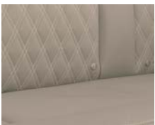
+ Echtleder-Wohnwelt Rubino ○