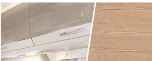
+ Holzdekor Noce Nagano