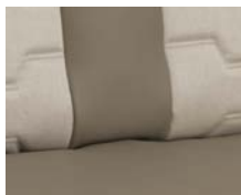
+ Wohnwelt Nubia ○