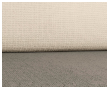
+ Wohnwelt Kapan