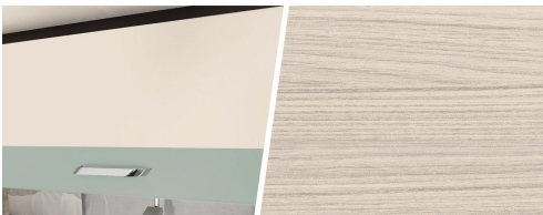
+ Holzdekor Tindari Bora