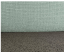
+ Wohnwelt Timor