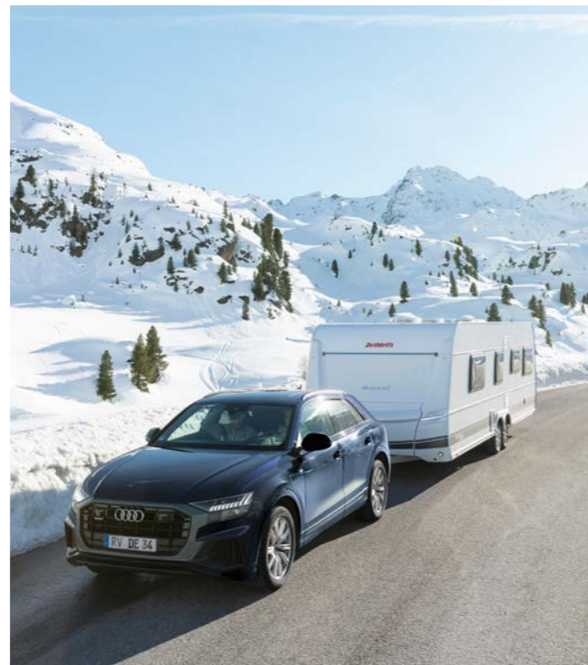
Sicher durch die kalte Jahreszeit mit einem winterfesten Wohnwagen mit Winterkomfort-Paket von Dethleffs.