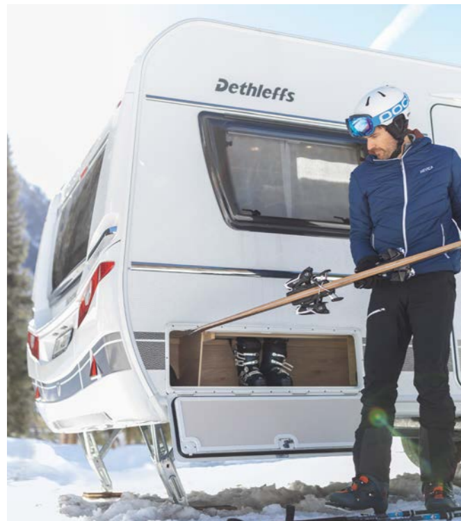
Eine Ferienwohnung direkt neben der Skipiste, innen wohlig-warm wie zu Hause.

Mit dieser, auf langjähriger Erfahrung basierenden Ausstattung bleibt es auch in bitterkalten Nächten wohlig-warm in Ihrem Wohnwagen und die Wasseranlage friert nicht ein.