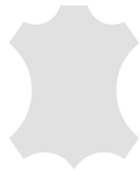
+ Echtleder Individual ○