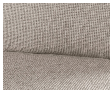
+ Textilleder- Wohnwelt Heron ○