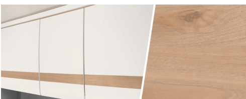
+ Holzdekor Noce Nagano