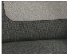
+ Wohnwelt Calypso inkl. Fahrer- und Beifahrer-Sitzbezug ○