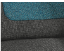
+ Wohnwelt Salerno inkl. Fahrer- und Beifahrer-Sitzbezug ○