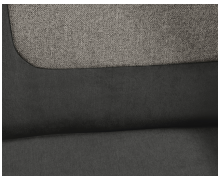
+ Wohnwelt Ravello