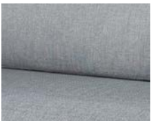
+ Wohnwelt Amposta