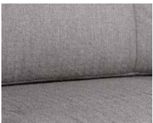
+ Wohnwelt Tarragona ○