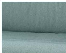
+ Wohnwelt Badalona ○