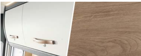
+ Holzdekor Amberes Oak