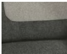
+ Wohnwelt Calypso inkl. Fahrer- und Beifahrer-Sitzbezug ○