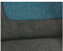
+ Wohnwelt Salerno inkl. Fahrer- und Beifahrer-Sitzbezug ○