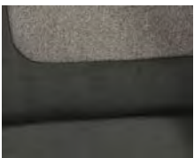
+ Wohnwelt Ravello