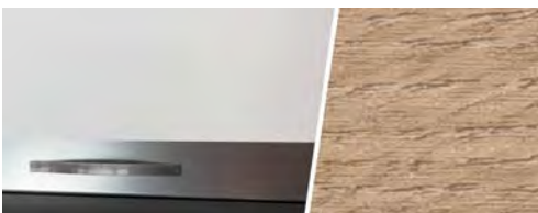
+ Holzdekor Amberes Oak