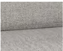
+ Wohnwelt Samir