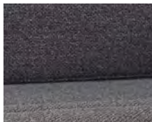
+ Wohnwelt Melia ○