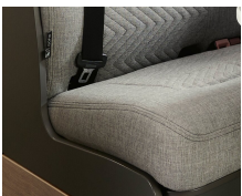
+ Stofkombination Scandi ○